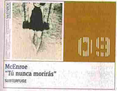
McEnroe "Tu nunca morirás" SUBTRIPULGE

Rock. El último cambio de ciclo de la banda ha dado lugar a una obra sencillamente genial. "Avida Dollars" configura un universo de vibraciones grandiosas, y se aprecia como la respuesta a la infinidad de comprensiones incabadas. El origen de ese cosmos en revolución es "Continental drift", un crescendo lineal que promueve airadamente el despeje de las voluntades. Esa invitación a la acción funciona de trampolín para el resto de un disco que, canción a canción, perfecciona una sonrisa en los labios, al tiempo que tensa algún nervio crucial en la espalda. Albert Fernández