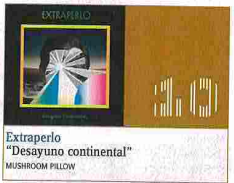
Extraperlo "Desayuno continental" MUSHROOM PILLOW

Ignición post-pop. No hay manera de contemplar este disco desde fuera. A menos que entres, aunque sólo sea un poco, en ese encendido bosque de Pumuky, difícilmente colmarás con estas letras. Una vez iniciado en el sendero, no te costará poner el corazón abierto, te habrás adentrado en una espesura sonora magnífica. La vegetación que envuelve estas canciones conforma una metuclosa formación natural, en la que Pumuky enreda guitarras airadas, teclados sugestivos, y baterías replicadas. El disco está en llamas: gracias por el fuego. Albert Fernández