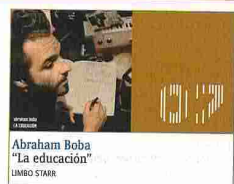
Abraham Boba "La educación" LIMBO STARR

Folk. Vanova, dúo afincado en Sitges (Barcelona), ha facturado un álbum sin fisuras, ni fronteras y cuidado en las formas (instrumental y vocalmente hablando) y en el fondo (letras, unas más crípticas, otras más cotidianas, pero todas ellas sencillamente maravillosas). Un disco acústico, orgánico, de melodías ambientales que te instalan en la melancolía, verterado a través de un folk que mira cara a cara, y sin robotizarse, a artistas de la talla de Bon Iver, Will Oldham, o Peter Dinklage, y que ocasionalmente transita por el pop y el rock de marcada influencia sixties. David Giménez