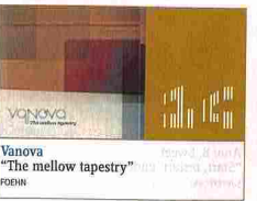
Vanova "The mellow tapestry" FOEM

Pop. "Desayuno continental" es una de las revelaciones de este año 2009. Canciones como "Bañadores", "Negroni" y "Las palmeras del amor" nos han alegrado el verano. En su esencia reside una efervescente mezcla tropical, que despierta tras una cálida y desasosegada mezcla pop que encuentra referentes tanto en Edwyn Collins como en Golpes Bajos. No es ninguna casualidad que "Desayuno continental" se encuentre entre los diez mejores, la joven banda de Barcelona se lo merece y llevan tiempo cosechando lo materializado en este álbum de debut. Amau Sabaté