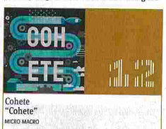
Cohete "Cohete" MICRO MACRO