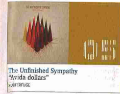
The Unfinished Symphony "Avida dollars" SUBTRIPULGE

Rock. El último cambio de ciclo de la banda ha dado lugar a una obra sencillamente genial. "Avida Dollars" configura un universo de vibraciones grandiosas, y se aprecia como la respuesta a la infinidad de comprensiones incabadas. El origen de ese cosmos en revolución es "Continental drift", un crescendo lineal que promueve airadamente el despeje de las voluntades. Esa invitación a la acción funciona de trampolín para el resto de un disco que, canción a canción, perfecciona una sonrisa en los labios, al tiempo que tensa algún nervio crucial en la espalda. Albert Fernández