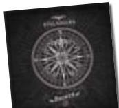
Soulsavers /// Broken. V2-Nuevos Medios

Quan les etiquetes defineixen Múm com folktrònica és que, al marge d'intents reflexius poc agraciats, la seva música ofereix sonoritats poc convencionals. Més allunyats de la seva vessant purament electrònica, els islandesos reapareixen molt més despulats d'artificis, amb un esperit igualment inquiet, però abocats a recrear-se amb els seus instruments de corda. Noves cançons d'exquisida factura onírica amb nous perfums folk. /// S.C.