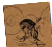
Tannhäuser /// Para entonces habrás muerto. Foehn

Les cançons de Roldan desprenen una frescor poc corrent. Serà perquè tenen una gràcia natural per al pop desquadrat, o pel desassossec que s'intueix darrere de les seves històries, o perquè en el fons cada cançó està gravada amb atenció al detall, però la veritat és que discos així no s'escolten cada dia. L'edició en vinil, amb una portada "tunejada" per a cada còpia, n'és un colofó fantàstic. No apte per a fans de Divine Comedy. /// O.V.