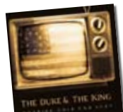
The Duke and the King /// Nothing Gold Can Stay. Houston Party

Des de Sevilla, aquesta formació de post-rock i shoegaze instrumental dibuixa un arc amb diferents gradacions de color i temperatures. Amb la seva música és possible contornejar-se amb intenció, amb suavitat o aixoplugar-se sense demanar explicacions i amb els llums de l'habitació apagats. L'esforç s'agraeix perquè el grup sona ben filat i sap escampar convincentment les seves idees. /// DIMAS RODRIGUEZ