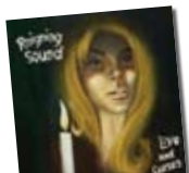
Reigning Sound /// Love and Curses. In The Red

Provinent de la música electrònica, Kim Cascone ha col·laborat en l'edició musical de sèries de David Lynch i presenta nou treball format d'un únic tall de 28 minuts i fort regust cinematogràfic. Paraula parlada i gravacions de camp enregistrades per tota Europa, formen aquesta càpsula de ficció sonora. Material no apte per a la ràdio fórmula, que ha trobat en el segell barceloní Störung un bon aliat. /// A. GIRON