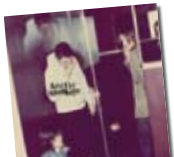
Arctic Monkeys /// Humburg. Domino Rec-PIAS

Evidència: la joveunit actual creix de pressa. Dos: el primer àlbum d'aquell grup d'adolescents comandat per Alex Turner va ser un discàs. Tres: tota banda tendeix a buscar la seva evolució. El quartet de Sheffield presenta tercera entrega i adopta una actitud més adulta i rockera. Humburg no s'accelera ni té pinzellades pop, mentre sembla que els Monkeys mediten un futur millor. El tindran, però no és aquí. /// S.C.