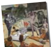
Alado Sincera /// Palimpsesto. Repetidor

"Here to fall" és el single que obre, amb bon peu, el nou llarg de YLT . La llum de mica en mica s'infiltra en unes cançons que rellueixen com en les millors ocasions. Només un final diluït entre distorsions envelluïdes i els dilatats grinyols de guitarra d' Ira Kaplan poden dissuadir l'oïent de plegar abans d'hora. El fet que la banda ja compti amb 12 discos i 25 anys de carrera queda en pura anècdota. /// A. GIRON