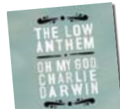
The Low Anthem /// Oh my God, ... Bella Union / Nuevos Medios