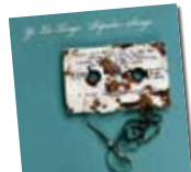
Yo La Tengo /// Popular Songs. Matador/Pop Stock