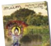
Múm /// Sing along to... Morr Music-PopStock!

Es desenganxa l'etiqueta r&b i estem obligats a citar els Estats Units. Però Flavio Rodriguez xiula amb ganes i atansa amb Eléctrico un tractat impecable de r&b cantat en castellà. Catorze temes que presenten un personatge, imaginari o no, que respira sexe, se sincera, fa declaracions d'intencions i és víctima de derrotes amoroses. L'atenta producció de JC Moreno suma a l'hora de confeccionar una sonoritat creïble. /// D.R.